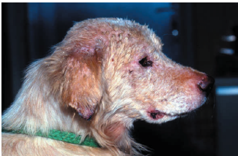
Hund mit Leishmaniose (li.), Malteser mit Augenentzündung (re. oben) und Spulwürmer im Dünndarm (re. unten)

Zoonosen wie Tollwut, Leishmaniose und Toxoplasmose gefährden Mensch UND Tier, Parasiten (Babesien, Spulwürmer, Bandwürmer etc.), bakterielle (Borelliose, Leptospirose, Salmonellose etc.) und virale Erkrankungen (Tollwut, Staupe, Parvovirose etc.) stellen ernstzunehmende Bedrohungen auch für andere Hunde dar.